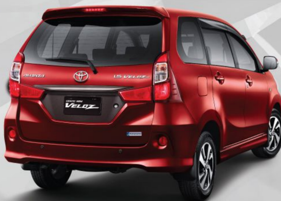
Tipe 1.5 A/T

Salah satu sistem keamanan pada kunci mobil agar terhindar dari pencurian. (Semua Tipe)